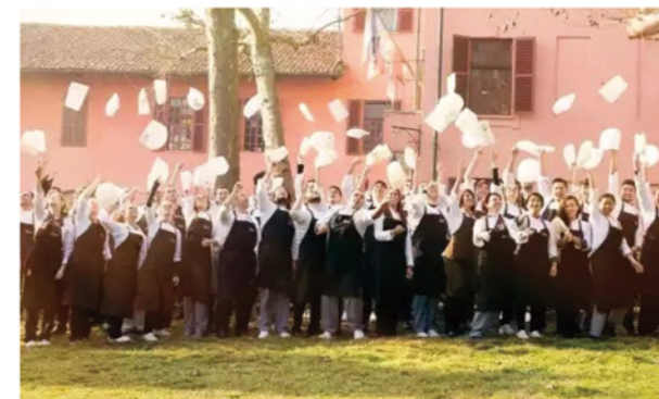
Students exchange 交换游学生项目

I.F.S.E.将“美食让生活更美好”的理念传播到世界各地，与食品专家、营养学家和著名农学家合作，旨在促进意大利西点烘焙的高质量教育，聚焦健康食品。