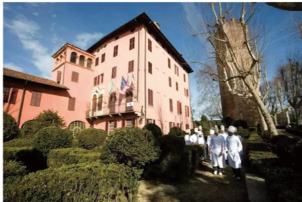
I.F.S.E.是意大利公认的具有创新力的意大利西点西餐学校。

I.F.S.E.的教学设备等位于各大高校的前列， 造就了一所独一无二的西点学校。 学校的实验室以先进的技术，和优质的意大利装修， 呈现出了优雅与功能性的完美融合。