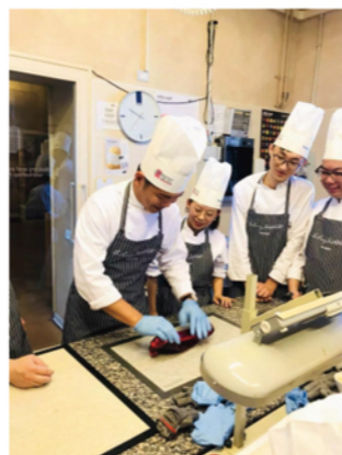
(图为欧米奇学院学员) 一起期待完成的样子吧