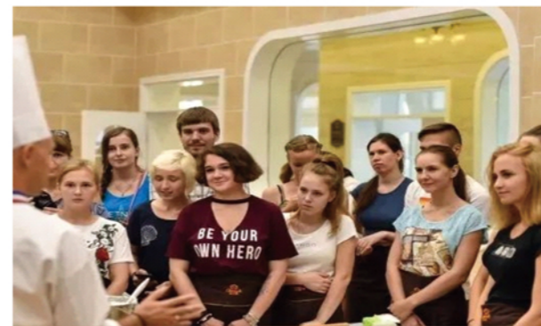
Culture exchange 中西方文化碰撞