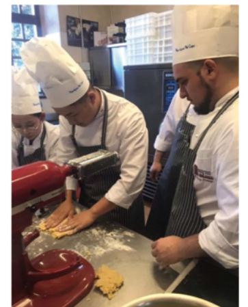
(图为欧米奇学院学员) 作品完成的那一刻是最幸福的