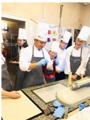
(图为欧米奇学院学员) 耐心指导

第三天，学员们早早就起来准备，期待一天课程的开始。今天老师为大家讲述了意大利西点的故事，从起源到发展至今的变化，让学员感受西点的发展历程，也激励大家能够将正统的西点文化延续传承下去。