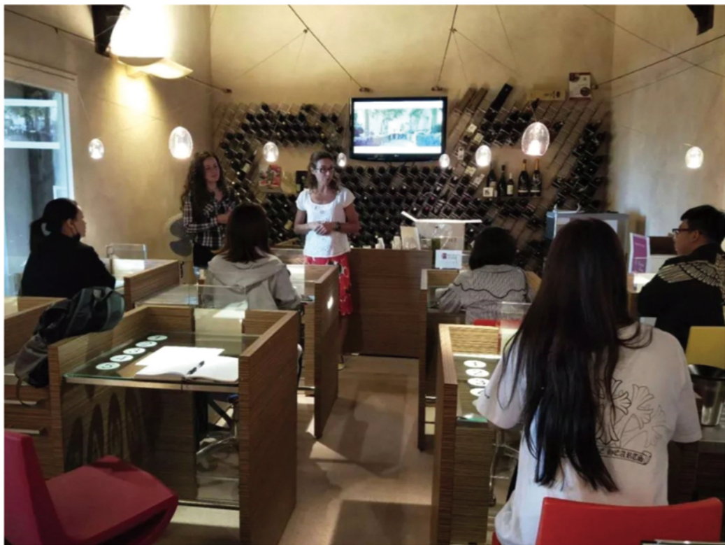
举办开学典礼并参观学院

开课前，皇家烹饪学院的老师带领学员参观了校园并给学员讲解了学院的教育理念和精髓，在这里是纯正的西点西餐教育，与欧米奇一样，全部课程都是理论+实操，需要学员们用心去体会西方美食文化的独特魅力。