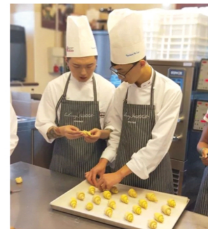
男生都变得细心了