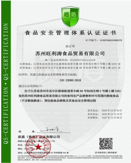
食品安全管理体系认证证书