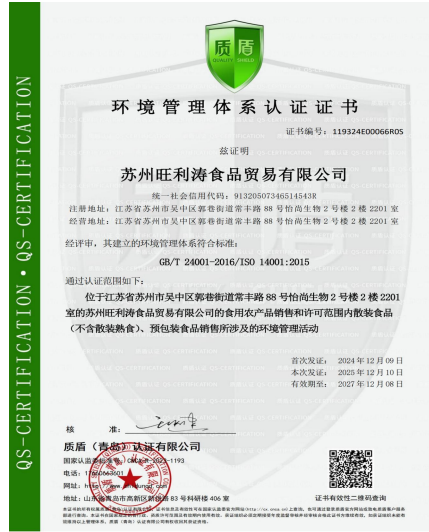
环境管理体系认证证书