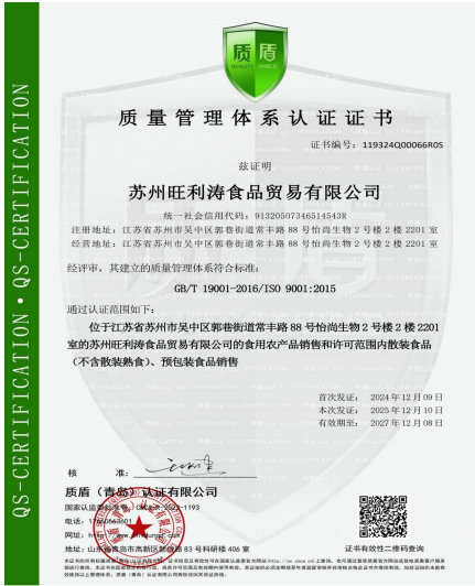
质量管理体系认证证书