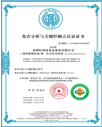
危害分析与关键控制点认证证书