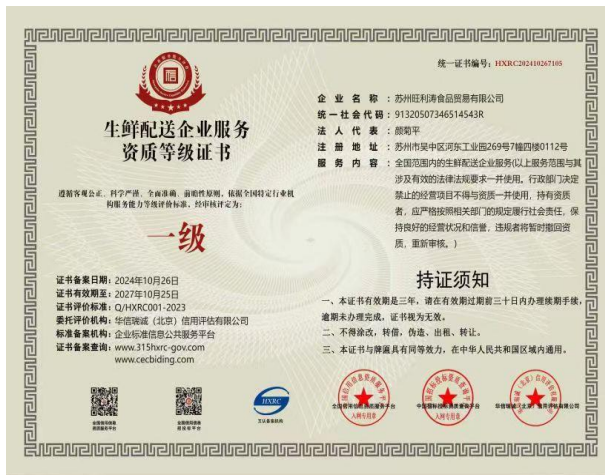
生鲜配送企业服务资质等级证书