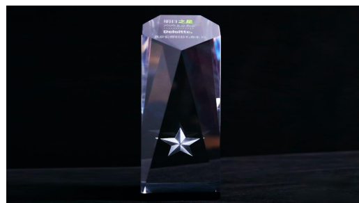
德勤-中国高科技高成长 50 强暨中国明日之星