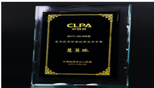
CLPA中合会-最具投资价值创新企业