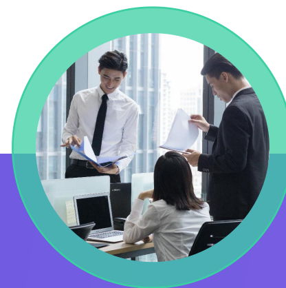
企业所得税汇算清缴