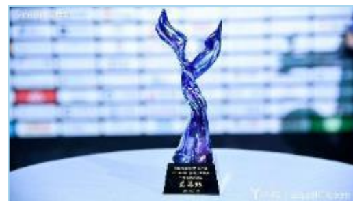
亿欧-中国智能企业服务年度创新力企业