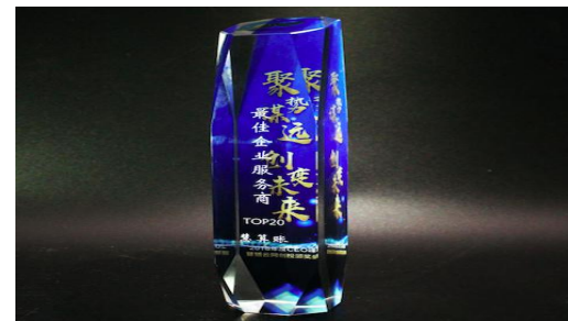
猎云网-最佳企业服务商