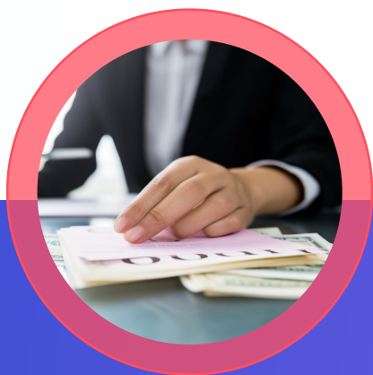
申请一般纳税人认定