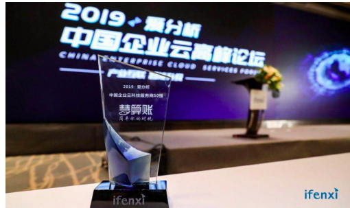
爱分析-中国企业云科技服务商