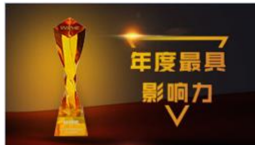
36氪-最具影响力代账服务商