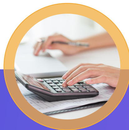
增值税进项发票认证