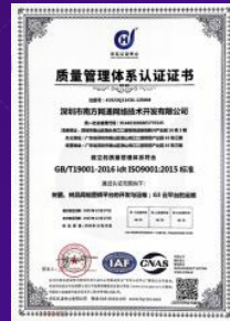
质量管理体系认证