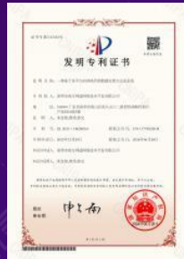
国家发明专利证书