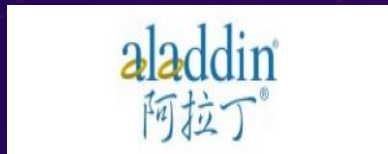
上海阿拉丁生化科技股份有限公司