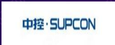
中控技术股份有限公司