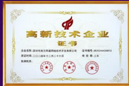
高新技术企业证书