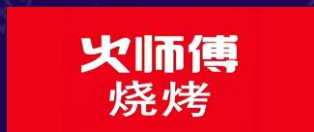
重庆火师傅餐饮管理 有限公司