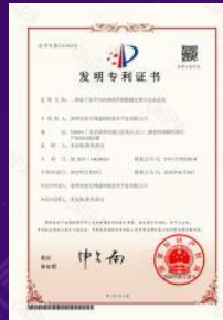
国家发明专利证书