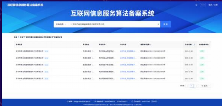
互联网信息服务算法备案系统