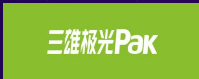
广东三维极光照明股份有限公司