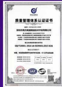
质量管理体系认证