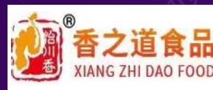
广汉市香之道食品 有限公司