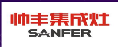
浙江帅丰电器股份有限公司