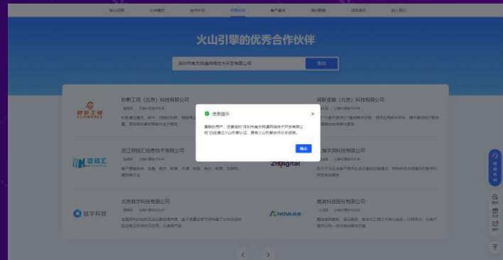
字节跳动-火山引擎生态合作伙伴