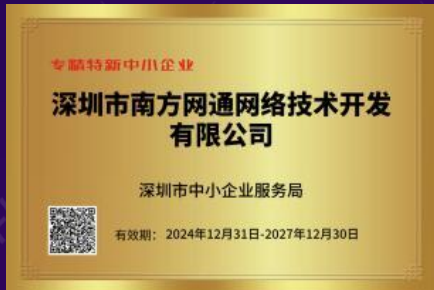
专精特新中小企业证书