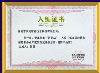
中国互联网2025年度创新产品