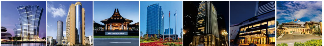
绍兴东方山水金沙酒店 上海汤臣洲际大酒店 三亚阿尔卡迪亚度假酒店 保定香江万达锦华酒店 贵阳温德姆花园酒店 北京河南大厦 登封中州华鼎饭店